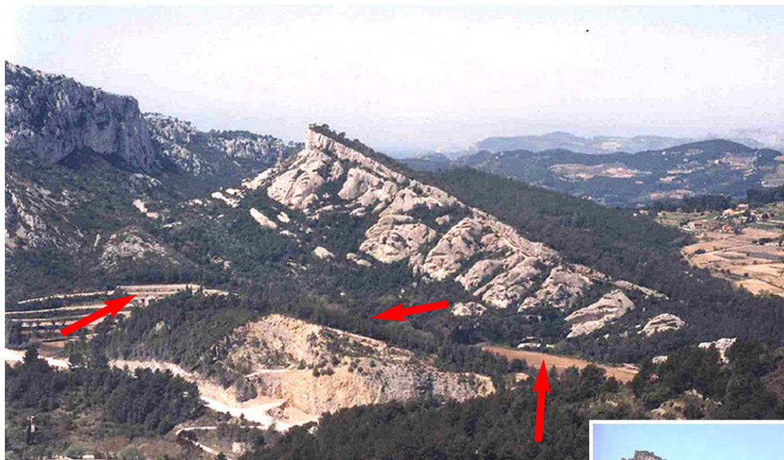
Les trois secteurs du site classé

SC Baou de Quatre Aures (20/03/1992) Ce site inclut les anciens SC de la rive droite du Destel et du vieux village d'Evenos et ses abords