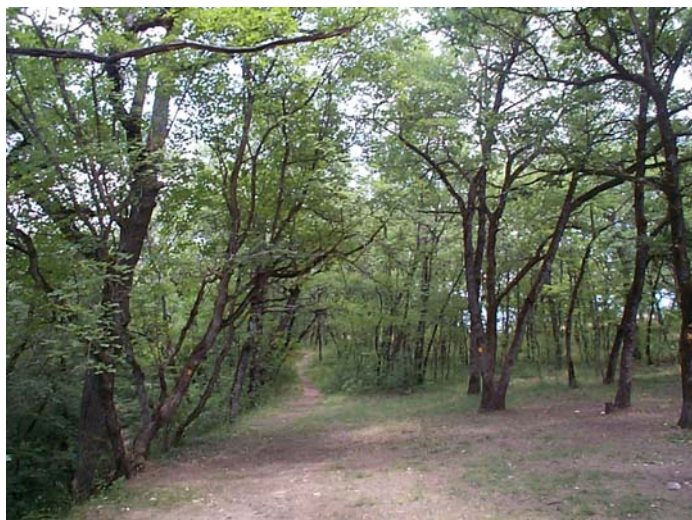
Vue du sous bois du parc.