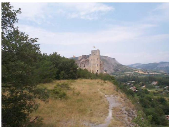
Vue depuis le parc sur le château et la vallée de la Durance